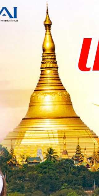
เจดีย์เยเลพญา