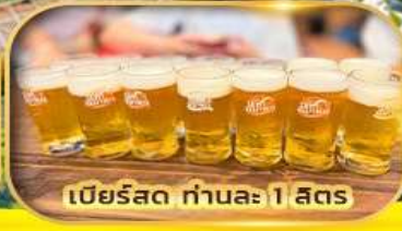
เบียร์สด ท่านละ 1 สตร