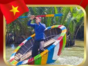
ล่องเรือกระดังกีมทาน