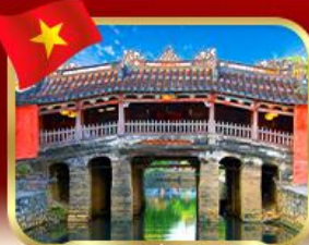
สะพานญูปุ่นโบราณ