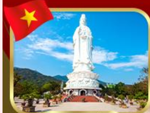
วัดหลิมอั้ง