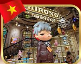
popmart บานาฮิลล์