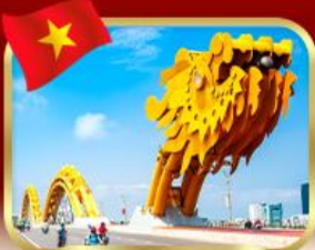
สะพานมังกร ดานัง