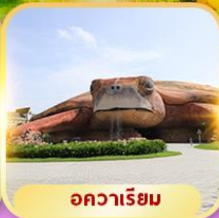
อควาเรียม