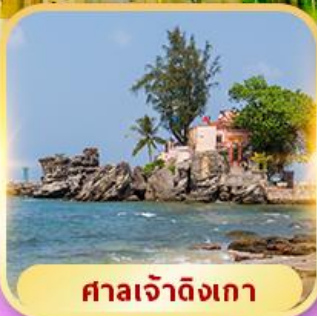
ศาลเจ้าดิงเกา