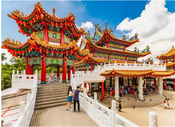
เจียงใต้

วัด Thean Hou เป็นวัดหกชั้นของเทพริดาแห่งท้องทะเล Mazu ของจีน ตั้งอยู่ในกรุงกัวลาลัมเปอร์ ประเทศมาเลเซีย ตั้งอยู่บนพื้นที่ 1.67 เอเคอร์ (6,758 ตร.ม.) บนยอดที่ดิน Robson Heights บน Lorong Bellamy มองเห็น Jalan Syed Putra สร้างเสร็จในปี 1987 และเปิดอย่างเป็นทางการในปี 1989 วัดแห่งนี้สร้างขึ้นโดยชาวโหลล่าที่อาศัยอยู่ในมาเลเซีย และทรัพย์สินเป็นของและดำเนินการโดย สมาคมไห่หนานเขตสลังงอร์และสหพันธรัฐ เป็นหนึ่งในวัดที่ใหญ่ที่สุดในเอเชียตะวันออกเฉียงใต้