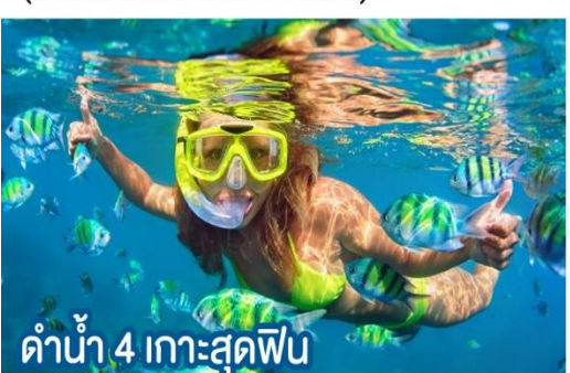
ดำน้ำ 4 เกาะสุดฟิน

✂ ราคารวมตัว ตัวเครื่องบินช่วงวันศุกร์ - อาทิตย์ เพิ่ม 500 - 1,000 บาท ● ราคาไม่รวมตัว ช่วงวันหยุดยาว เพิ่ม 1,500 - 2,000 บาท ไม่รวมตัว เครื่องบิน เติงสมรผู้ใหญ่ 3,300/ท่าน 0-5 ปี ฟรี 6-12 ขวบ 1,050/ท่าน รวมตัว เครื่องบิน เติงสมรผู้ใหญ่ 6,250/ท่าน 0-3 ปี (ใช้ราคาอีกครั้ง) 6-12 ขวบ 4,250/ท่าน