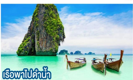
เรือพาไปดำน้ำ