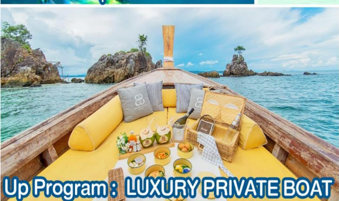
Up Program : LUXURY PRIVATE BOAT