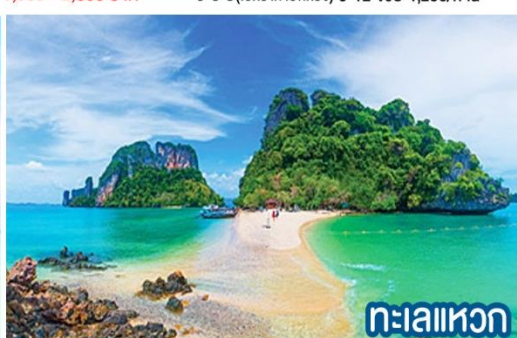
ทะเลแหวก