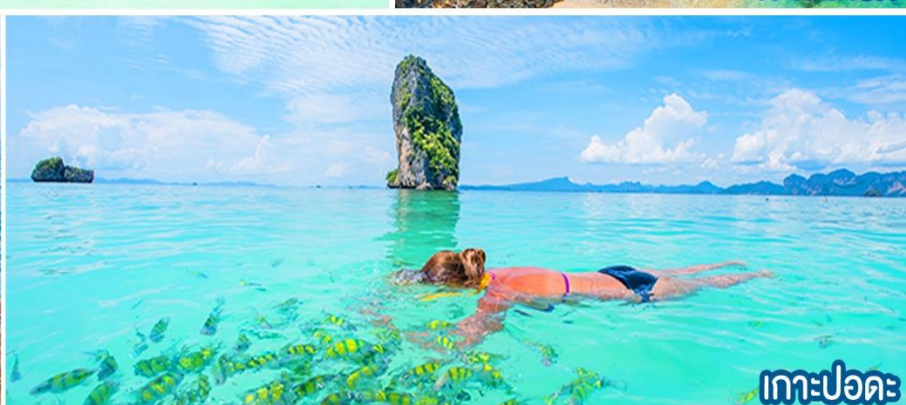
เกาะปอดะ