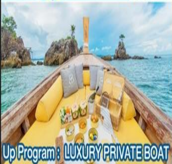
Up Program: LUXURY PRIVATE BOAT