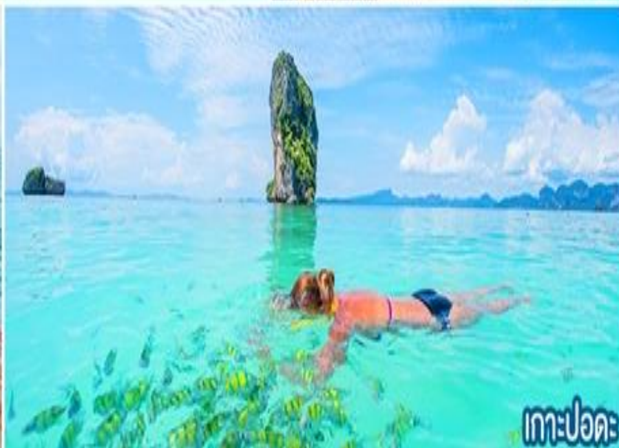
เกาะปอดะ