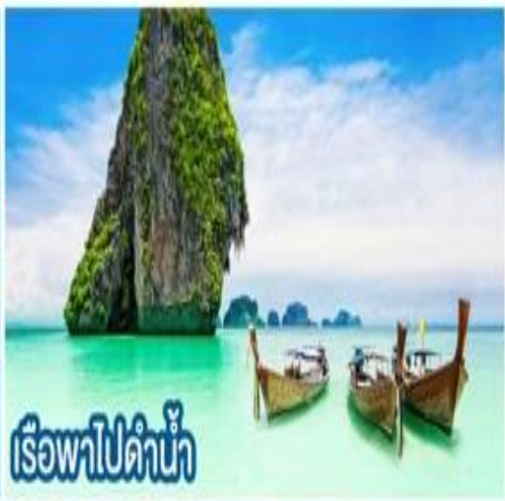
เรือพาไปดำน้ำ