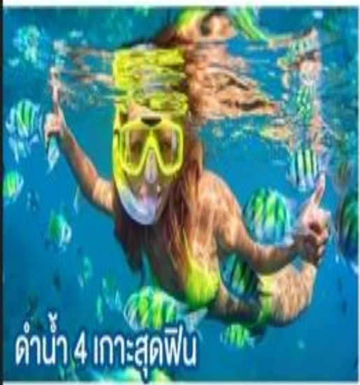
ดำน้ำ 4 เกาะสุดฟิน