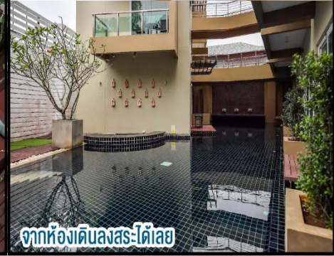
วิวสระมองเห็นห้อง