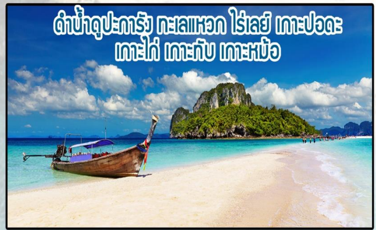
ดำน้ำดูปะการัง ทะเลแหวก ไร่เลย์ เกาะปอดะ เกาะโก๋ เกาะทับ เกาะหม้อ

วันที่ 1 ลุกค้าเดินทางสู่ที่พัก เช็คอินที่ หลัง 14.00 น. พักผ่อนตามอัธยาศัย วันที่ 2 ทานอาหารเช้ามื้อที่ 1 (เลือก1โปรแกรม) - 1. ดำน้ำ 8.05-8.15 น. เจ้าหน้าที่ขับรถมารับ ลุกค้าเพื่อไป ทริบดำน้ำดูปะการัง ตามโปรแกรม หาดไร่เลย์ ถ้าพระนาง เกาะหม้อ เกาะทับ ทะเลแหวก เกาะโก๋ เกาะปอดะ เดินทางกลับสู่ที่พัก (จุดดำน้ำอาจมีการเปลี่ยนแปลงตามประกาศอุทยาน และสภาพอากาศ) (ทานอาหารมื้อที่ 2 + อุปกรณ์ดำน้ำฟรี) เดินทางกลับที่พัก - 2. ทานอาหารเย็น 17.30-18.30น. มื้อเย็นที่ 2 ทานแบบเซ็ทโต๊ะ วันที่ 3 ทานอาหารเช้ามื้อที่ 3 เช็คเอาท์ ก่อนเวลา 12.00 น. ลุกค้าเดินทางกลับเองโดยสวัสดิภาพ