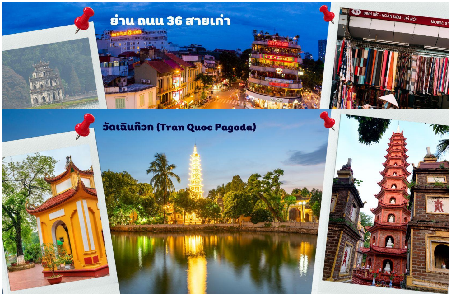
ย่าน ถนน 36 สายเก่า

จากนั้นนำท่านไป วัดเจินก๊วก (Tran Quoc Pagoda) เป็นวัดที่อยู่ใจกลางเมืองของเวียดนาม ใกล้ชิดกับทะเลสาบตะวันตกของเมืองฮานอย สร้างด้วยสถาปัตยกรรมจีนโบราณ มีความร่มรื่น และบรรยากาศดี จึงเป็นที่นิยมของนักท่องเที่ยวทั้งที่ชื่นชมความงามและมีศรัทธาในพระพุทธศาสนา จากภาพมุมสูงของสถานที่ตั้ง ที่นี้เหมือนตั้งอยู่บนเกาะที่ยื่นลงไปทะเลสาบ แต่มีเส้นทางคมนาคมเข้าถึงที่ สิ่งปลูกสร้างมีการวางผังเป็นอย่างดี ใช้สีสันทึกลมกลืนในโทนสีเหลือง น้ำตาล ตัดกับสีเขียวของต้นไม้ใหญ่ที่โอบล้อมอยู่ในมุมถ่ายภาพจากอีกฝั่งหนึ่ง จะเห็นสิ่งปลูกสร้างสไตล์จีน และเจดีย์หลายชั้นโดดเด่น มีภาพที่สะท้อนลงสู่ผิวน้ำเป็นภูมิทัศน์ที่งดงามทั้งยามกลางวันและยามค่ำคืนที่มีการเปิดไฟส่องสว่าง จากนั้นนำท่านไป ทะเลสาบคินดาบ มีทะเลสาบน้ำสีเขียวอยู่ที่ใจกลางเมืองฮานอย ทะเลสาบน้ำจืดแห่งนี้ชื่อฮว่านเกียม แปลว่า ทะเลสาบคินดาบ มีตำนานเล่าต่อกันมาว่า ในศตวรรษที่ 15 จักรพรรดิจักรพรรดิเลเหล่ย์ (Le Loi) ได้รับดาบวิเศษจากสวรรค์และใช้ดาบนั้นต่อสู้กับกองทัพจีนจนได้รับเอกราช หลังจากนั้นวันหนึ่ง จักรพรรดิได้ลงเรือล่องไปในทะเลสาบพร้อมกับดาบ มีแต่ยักษ์ชั้นมารับดาบวิเศษแล้วดำลงสู่ใต้น้ำหายไป จึงเป็นที่มาของชื่อทะเลสาบกลางเมืองฮานอย