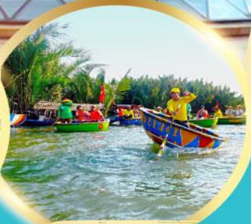
ล่องเรือกระด้ง