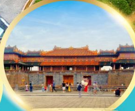
พระราชวังโบราณไคโนย

เมนูพิเศษ ! กุ้งมังกรซอสเนย + หม้อไฟทะเล SEAFOOD 1 มื้อ, บึงย่าง ภูเขา 1 มื้อ