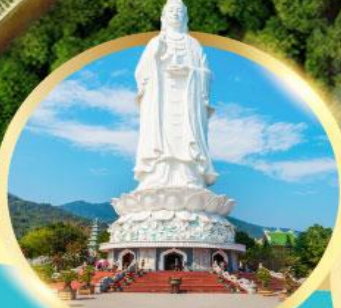
วัดหลิงอิ่ง