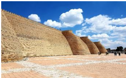
ป้อมดิอาร์ค

นำท่านชม ด้านนอกและถ่ายรูปกับ ป้อมดิอาร์ค ป้อมปราการแห่งบูคาร่า (Ark of Bukhara) ซึ่งเป็นป้อมเก่าแก่สร้างในศตวรรษที่ 5 ตั้งอยู่ใจกลางเมือง และเมื่อขึ้นไปด้านบนของป้อมจะสามารถเห็นวิวทิวทัศน์ของเมืองได้อย่างชัดเจน มีกำแพงล้อมรอบมีความยาวประมาณ 800 เมตร ส่วนของกำแพงมีความสูงถึง 16-20 เมตร ถูกสร้างด้วยอิฐหนาที่บดและสูงใหญ่ ส่วนประตูมีซุ้มโค้งและหอคอยทั้งสองด้าน ซึ่งในอดีตภายในถูกใช้เป็นศูนย์กลางการปกครอง ชม สุเหร่าไม้ (Bolo Hauz Mosque) เป็นอาคารสุเหร่าในสมัยกลาง ถูกสร้างขึ้นในปี ค.ศ. 1712-1713 รูปแบบในการก่อสร้างประกอบไปด้วยเสาไม้ที่มีความสูงมาก อาคารด้านหน้ามีเสาไม้ประดับมากกว่า 20 ต้นรองรับแดดฟ้าหลังคา ต่อมาในปี ค.ศ. 1917 ก็ได้ใช้สถานที่แห่งนี้เป็นสุเหร่าอย่างเป็นทางการมาจนถึงปัจจุบันนี้ ชม หอโพลี คัลยาน (Poli Kalyan Ensemble and Kalon Minaret) ถูกสร้างขึ้นในปี ค.ศ. 1127 โดย อาสลาฮัน แห่งราชวงศ์คารานิด อยู่ในการปกครองของบูคาร่า และสามารถทำให้ผู้พบเห็นต้องตกตะลึงถึงความโอ่อ่างดงามในรูปร่างของหอนี้ ส่วนที่สูงที่สุดเป็นทรงกลม หอนี้ได้ถูกออกแบบเพื่อใช้ในการทำละหมาดของชาวมุสลิม หอคอยแห่งนี้ได้ถูกซ่อมแซมขึ้นใหม่ในศตวรรษที่ 15