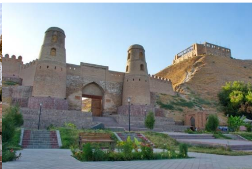
ป้อมปราการฮิสซาร์