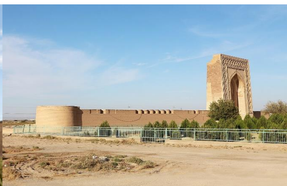
สุเหร่าบิบี คะนูนม