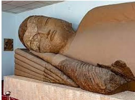
พิพิธภัณฑโบราณวัตถุแห่งชาติ

นำท่านเข้าสู่ที่พัก Atlas Hotel หรือเทียบเท่า