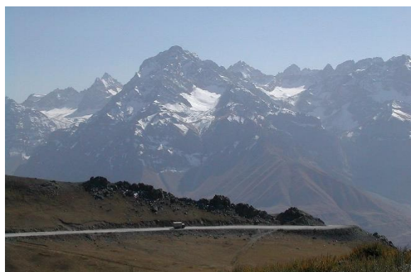
ช่องเขาแอนซอพพาส