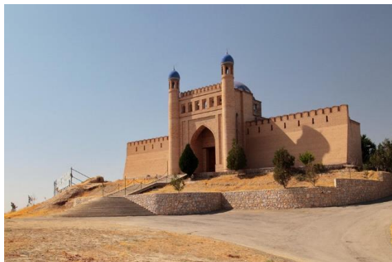
ป้อมปราการมัคเทปเป

นำท่านเข้าสู่ที่พัก Atlas Hotel หรือเทียบเท่า