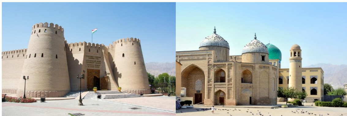
ปราสาททาเมมาริค

นำท่านเข้าสู่ที่พัก Parliament Palace Hotel หรือเทียบเท่า