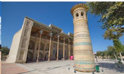
สุเหร่าไม้