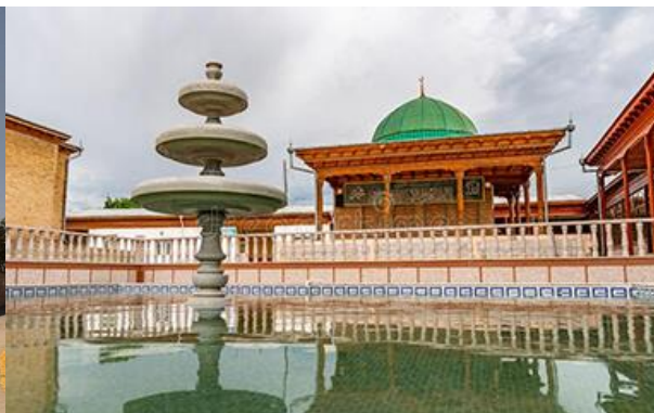
กลุ่มอาคาร khazrati shoh