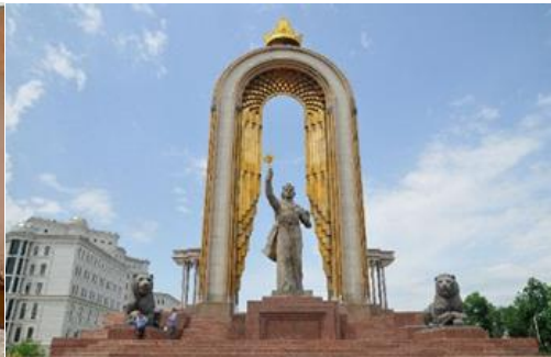
อนุสาวรีย์อิสมาอิล ซามานี