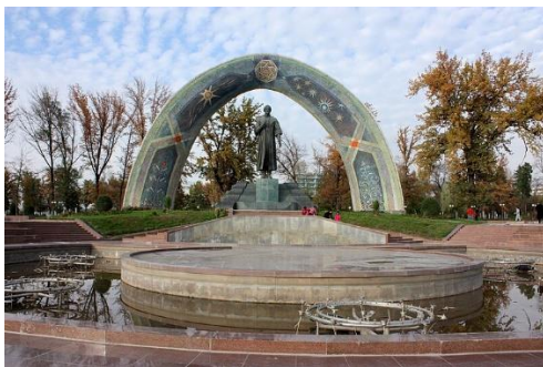
สวนสาธารณะรูดากี