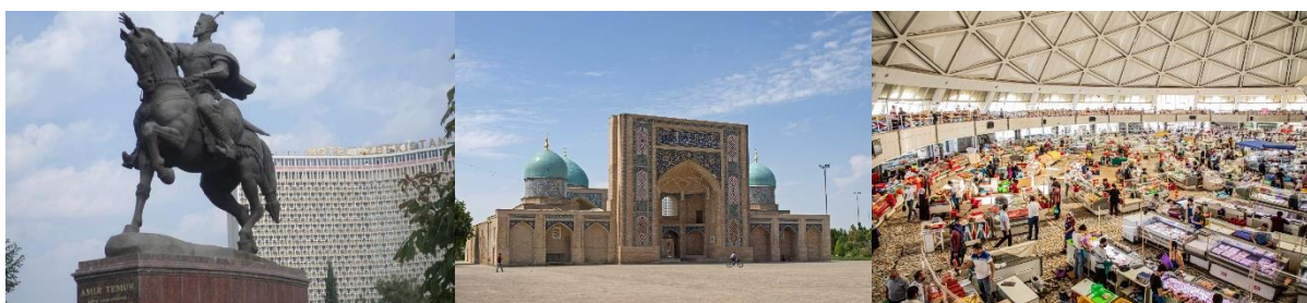
จัตุรัสอามิร ติมูร์