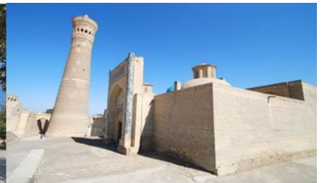
หอโพลี คัลยาน