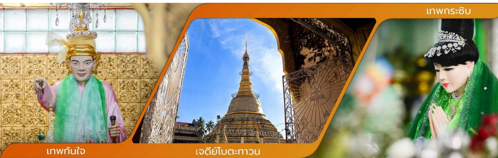
เทพทันใจ

คำบูชาเทพทันใจ เอหิ สักกะ มหานัทโปิระปิระจีโปตะถ่องสิทธิมัตถุ อิทังพะลัง เอตัสสะมิงรัตตะนัง พุทธังธัมมัง สังฆัง เทวานัง ประสิทธิลาโภ ชยโยนิจัจจ วันทามิสัพพะทา สวาโหม