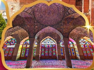
Nasir al Molk Mosque