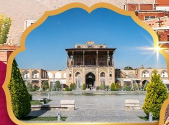
Ali Qapu Palace