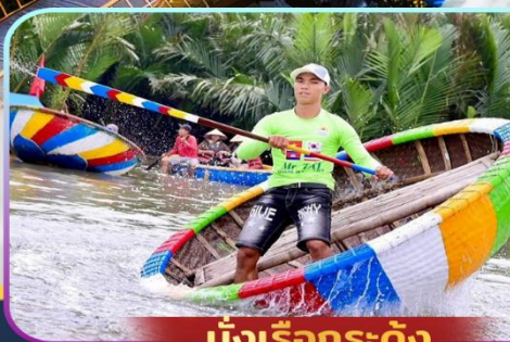
นั่งเรือกระดง