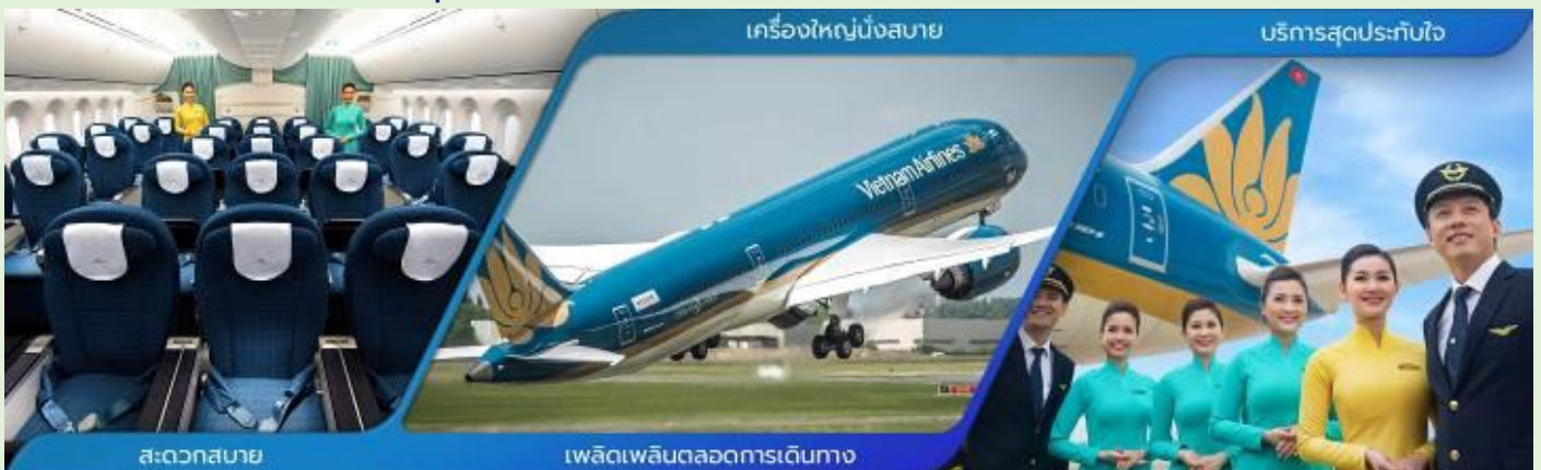
3 ภาพใช้เพื่อการโฆษณาเท่านั้น