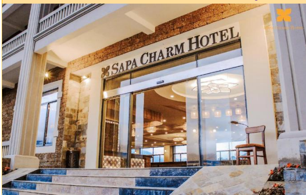
Sapa Charm Hotel

Option 2 : Sapa Charm Hotel // Hotel De Sapa // Highland Sapa 4 ดาว มาตรฐานเวียดนาม หรือเทียบเท่า คั้น 1 และ คั้น 2 Chalcodony Hanoi Hotel 4 ดาวมาตรฐานเวียดนาม หรือ เทียบเท่า คั้น 3 A25 Luxury Hotel 4 ดาวมาตรฐานเวียดนาม หรือ เทียบเท่า คั้น 3 The Light Hotel 4 ดาวมาตรฐานเวียดนาม หรือ เทียบเท่า คั้น 3