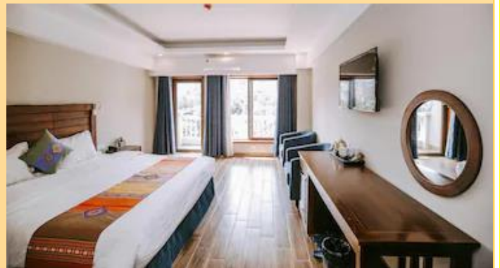
Hotel De Sapa