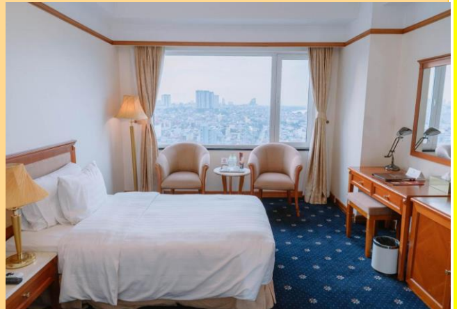
The Light Hotel ( 3 ดาว )