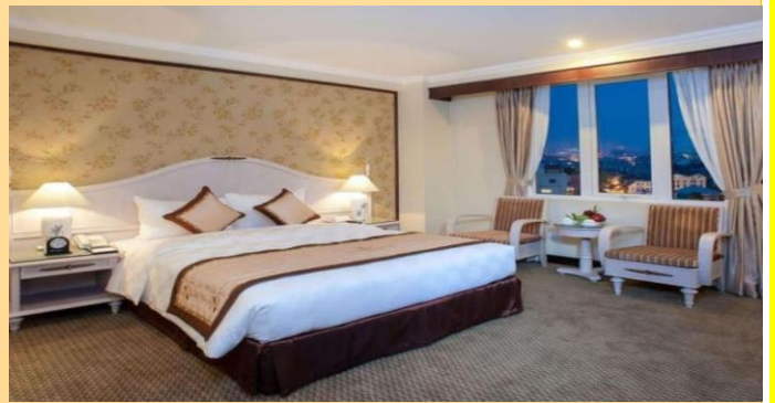
A25 Luxury Hotel ( 3 ดาว )