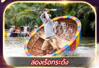
ล่องเรือกระด้ง

สัมพัศความงามหมู่บ้านฝรั่งเศสที่ บานาฮิลล์ 1 คืน เยือนเมืองโบราณฮอยอัน ล่องเรือกระด้ง