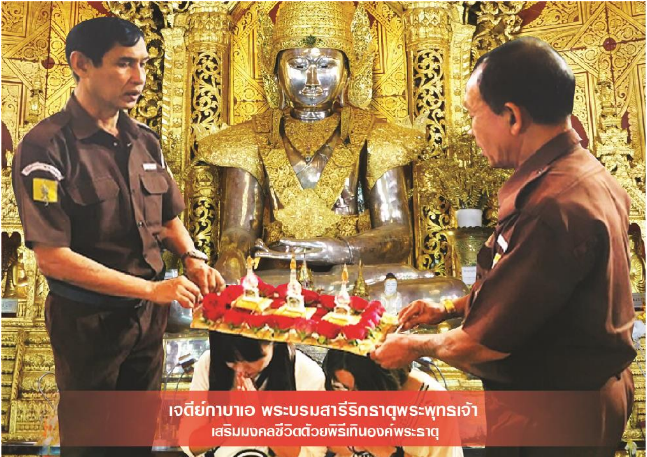
เจดีย์กาบาเอ พระบรมสารีริกธาตุพระพุทธรเจ้า เสริมมงคลชีวิตด้วยพิธีเทินองค์พระธาตุ

นำท่านสักการะ พระเจดีย์กาบาเอ เป็นเจดีย์ทรงกลม มีทางเข้าทั้งหมดห้าด้าน ทุกด้านจะมีพระพุทธรูป ประดิษฐานอยู่บนฐานทักษิณ มีพระพุทธรูปหุ้มด้วยทองคำ องค์เล็กๆอีก 28 องค์ แทนอดีตสาวกของ พระพุทธเจ้า ทั้ง 28 องค์ มีความสูง และเส้นผ่าน ศูนย์กลางคือ 34 เมตร สร้างโดยนายอุณูนายกคนแรก ของพม่า เพื่อใช้เป็นสถานที่สังคายนาพระไตรปิฎก ในปี ค.ศ. 1954 – 1956 และอุทิศ พระเจดีย์องค์นี้ เพื่อให้เกิดการสร้าง สันติภาพขึ้นในโลก ภายในองค์พระเจดีย์บรรจุ พระบรมธาตุ มีพระอรหันต์สาวกองค์ สำคัญ สององค์ มีพระพุทธรูปองค์พระประธาน ที่อยู่ข้างในหล่อด้วยเงินบริสุทธิ์มีน้ำหนัก กว่า 500 กิโลกรัม