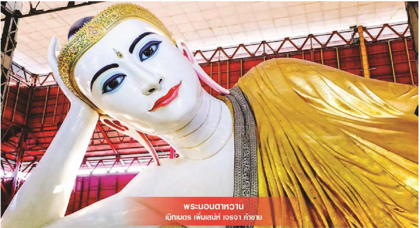
พระนอนตาหวาน เบ็กนตธ เฝ้เมสน่ห้ เอรจา ค้าขาย