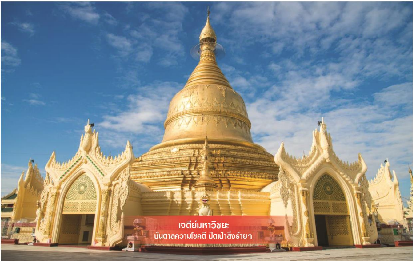
เจดีย์มหาวิชัย บันดาลความโชคดี ปัดเป่าสิ่งร้ายๆ

นำท่านไหว้ขอพร นัตโบโบยี หรือเทพทันใจ เทพศักดิ์สิทธิ์ ซึ่งชาวมอญ และพม่านิยม มากกราบ ไหว้ สักการะบูชาเพราะ เชื่อว่าอธิษฐานขอสิ่งใดแล้วจะได้ตามปรารถนาสมหวัง ทันใจ