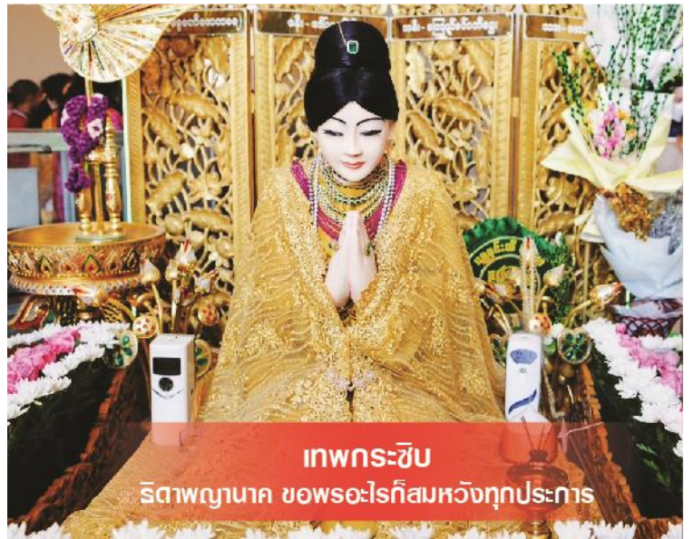
เทพกระซิบ ริตถาพญานาค ขอพระอะไรก็สมหวังทุกประการ

นำท่านไหว้ขอพร นัตโบโบยี หรือเทพทันใจ เทพศักดิ์สิทธิ์ ซึ่งชาวมอญ และพม่านิยม มากกราบ ไหว้ สักการะบูชาเพราะ เชื่อว่าอธิษฐานขอสิ่งใดแล้วจะได้ตามปรารถนาสมหวัง ทันใจ