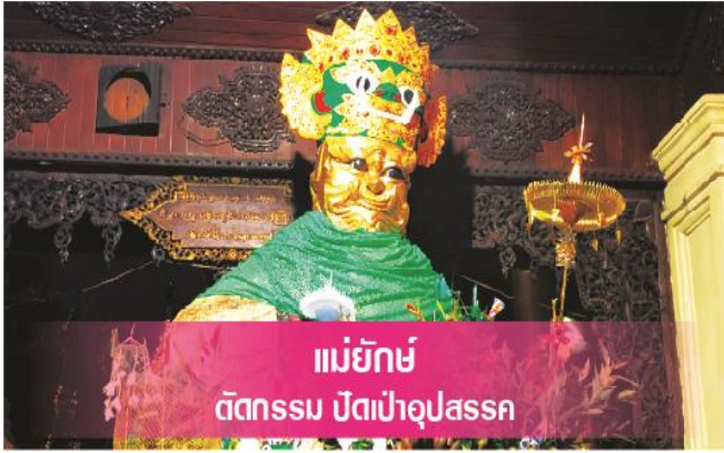
แม่ยักษ์ ตักธรรม ปิตาเปาอุปาสก

*พามู “แม่ยักษ์” คนพม่าเชื่อว่าแม่ยักษ์จะช่วยใน การตัดกรรมจากเจ้ากรรมนายเวร ให้ชีวิตของคุณมี แต่ดีขึ้นเรื่อยๆ และยังช่วยเรื่องความมีชื่อเสียงโด่ง ดัง เป็นที่รู้จักในหน้าที่การงาน*