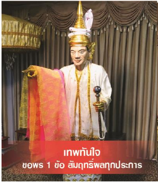
เทพทันใจ ขอพร 1 ข้อ สัมฤทธิ์ผลทุกประการ