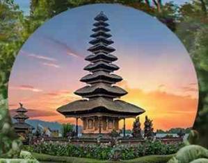
วัดจูลินดาญู