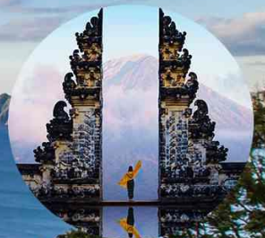
วัดเลมปุงก