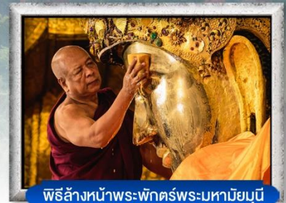
พิธีล้างหน้าพระพักตร์พระมหาเมียนุณี