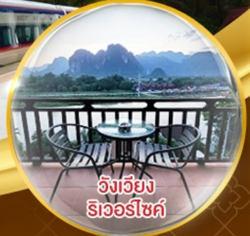
วังเวียง ริเวอร์ไซด์