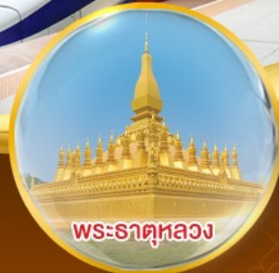
พระธาตุหลวง