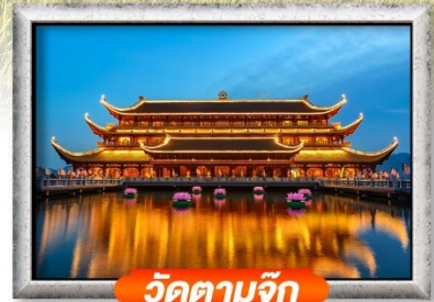
วัดตามจึก