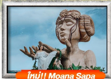
ใหม่!! Moana Sapa