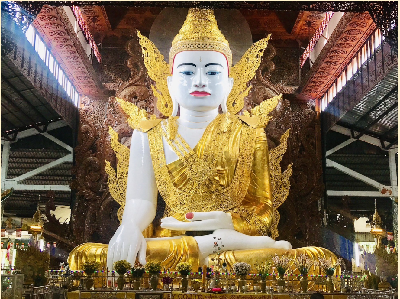
นำท่านนมัสการ วัดพระเชี้ยวแก้วจุฬามณี (Buddha Tooth Relic Pagoda)

ประเทศเพื่อนบ้านที่เราต่างรู้จักกันดีมาตั้งแต่ไหนแต่ไรอย่างพม่า หรือ พม่า ที่นับวันนั้นจะเรียกว่าเนื้อหอมเป็นอย่างมากทั้งทางด้านการลงทุนและด้านการเมือง ส่วนการท่องเที่ยวนั้นเรียกได้ว่ามาแรงแข่งโค้งประเทศอื่นๆ ในภูมิภาคกันเลยทีเดียวได้ไม่เว้นแม้แต่นักท่องเที่ยวจากเมืองไทย ที่ต่างก็มุ่งหน้าไปท่องเที่ยวยังดินแดนแห่งนี้กันอย่างหนาแน่น โดยมีสถานที่ท่องเที่ยวที่น่าสนใจอยู่หลายแห่งด้วยกัน รวมทั้งที่ วัดพระเชี้ยวแก้วจุฬามณี ซึ่งนับได้ว่ามีความสวยงามและเป็นที่ยอมรับกันของนักท่องเที่ยวที่จะเดินทางมาเยี่ยมเยือนกันอย่างไม่ขาดสาย