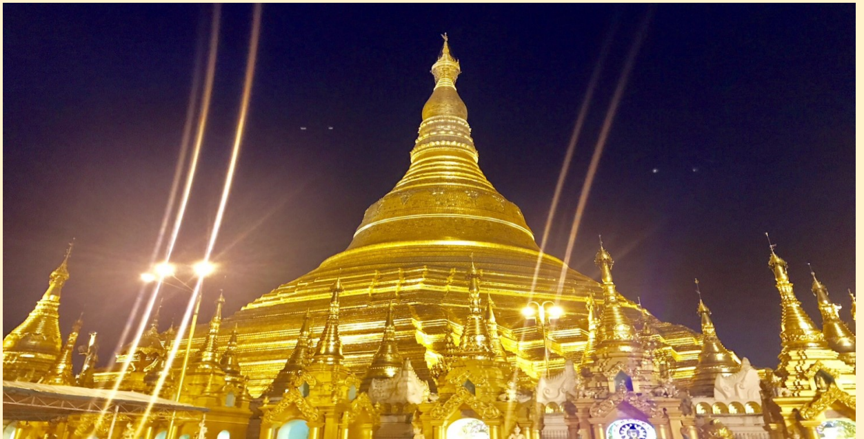
บทกวีนาบุชาพระมหาเจดีย์ชเวดากอง

จากนั้นนำท่านกราบนมัสการ พระมหาเจดีย์ชเวดากอง(Shwedagon Pagoda) พระเจดีย์ทองคำคู่บ้านคู่เมืองประเทศพม่าอายุกว่าสองพันห้าร้อยกว่าปี เจดีย์ทองแห่งเมืองดากอง หรือ ตะเกิง ชื่อเดิมของเมืองย่างกุ้งมหาเจดีย์ที่ใหญ่ที่สุดในพม่าสถานที่แห่งนี้มีลานอธิษฐานจุดที่บูเรงนองมาขอพรก่อนออกรบท่านสามารถนำดอกไม้ธูปเทียนไปไหว้เพื่อขอพรจากองค์เจดีย์ชเวดากองณลานอธิษฐานเพื่อเสริมสร้างบารมีและสิริมงคลนอกจากนี้รอบองค์เจดีย์ยังมีพระประจำวันเกิดประดิษฐานทั้งแปดทิศรวมองค์หากใครเกิดวันไหนก็ให้ไปสรงน้ำพระประจำวันเกิดตนจะเป็นสิริมงคลแก่ชีวิตพระเจดีย์นี้ได้รับการบูรณะและต่อเติมโดยกษัตริย์หลายรัชกาลองค์เจดีย์ห่อหุ้มด้วยแผ่นทองคำทั้งหมดน้ำหนักยี่สิบสามตันภายในประดิษฐานเส้นพระเกศาธาตุของพระพุทธเจ้าจำนวนแปดเส้นและเครื่องอัฐบริขารของพระพุทธเจ้าองค์ก่อนทั้งสามพระองค์ บนยอดประดับด้วยเพชรพลอยและ อัญมณีต่างๆจำนวนมากและยังมีเพชรขนาดใหญ่ประดับอยู่บนยอดเจดีย์ ท่านจะได้ชมความงามของวิหารสี่ทิศซึ่งทำเป็นศาลาโถงครอบด้วยหลังคาทรงปราสาทซ้อนเป็นชั้น ๆงานศิลปะและสถาปัตยกรรมทุกชิ้นที่รวมกันขึ้นเป็นส่วนหนึ่งของพุทธเจดีย์ล้วนมีตำนานและภูมิหลังความเป็นมาทั้งสิ้น ชมระฆังใบใหญ่ที่อังกฤษพยายามจะยึดเอาไปแต่เกิดพัดตกแม่น้ำย่างกุ้งเสียก่อน อังกฤษก็ทำใ้ไรก็ไม่สามารถนำขึ้นจากแม่น้ำได้ภายหลังชาวพม่าช่วยกันกู้ขึ้นมาแขวนไว้ที่เดิม จึงถือเป็นสัญลักษณ์แห่งความสามัคคีซึ่งชาวพม่าถือว่าเป็นระฆังศักดิ์สิทธิ์ให้ตีระฆัง3ครั้งแล้วอธิษฐานขออะไรก็ได้ตั้งสมความปรารถนา จากนั้นให้ท่านชมแสงของอัญมณีที่ประดับบนยอดฉัตรโดยจุดชมแต่ละจุด ท่านจะได้เห็นแสงสีต่างกันไป เช่น สีเหลือง, สีน้ำเงิน, สีส้ม, สีแดง เป็นต้น