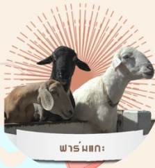
ฟาร์มแกะ: