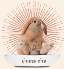
บ้านกระต่าย