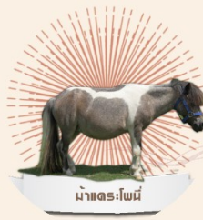
ม้าและไพนี