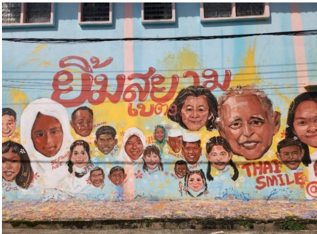
สตรีทอาร์ตเบตง (Street Art Betong)

แลนด์มาร์กใหม่ของเบตง เป็นผลงานที่ถูกสร้างขึ้น เพื่อดึงดูดนักท่องเที่ยวให้ประทับใจและได้ถ่ายภาพเป็นที่ระลึก ภาพที่เขียนส่วนใหญ่ จะเป็นภาพที่บอกเล่าเรื่องราววิถีชีวิต ความหลากหลายทางวัฒนธรรมของชาวเบตง รวมไปถึงสัญลักษณ์ต่างๆ ที่มีอยู่จริงใน อ.เบตง เช่น ตู้ไปรษณีย์ที่ใหญ่ที่สุดในโลก ซึ่งภาพถูกวาดทั้งหมด 11 จุด ทั้งบนผนัง กำแพง ใต้สะพาน และตัวอาคารหลายจุดรอบเมืองเบตง