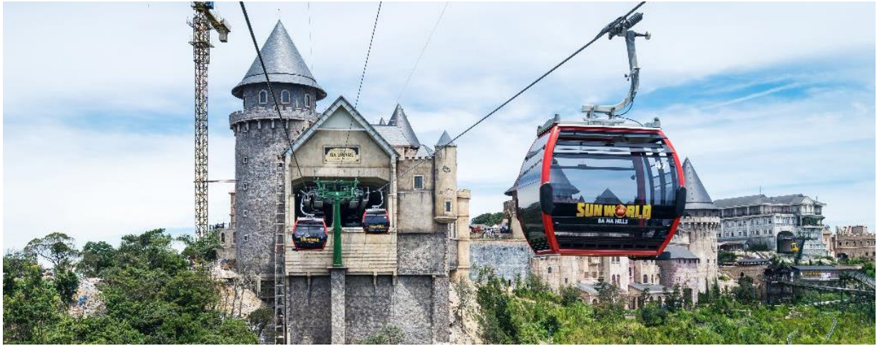
นำท่านชมจุดเช็คอินโซนใหม่บนบานาฮิลล์ Luna Castle ปราสาทจันทร์ทรา