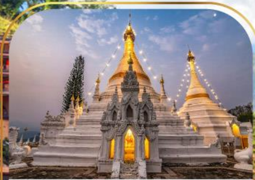
พระธาตุดอยกองมู