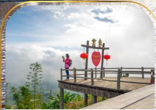
จุดชมวิวกะแลหมอกหุบไหล่

ปาย | แม่ฮ่องสอน | วัดพระธาตุมะเข็ญ | ถนนคนเดินปาย จุดชมวิวกะแลหมอกหุบไหล่ | หมู่บ้านจันยูมานลับตึชล | วัดน้ำอ้อย บ้านรักไทย | ปางอุ๋ง | สะพานชุตองเป่ | วัดจองคำ จองกลาง พระธาตุดอยกองมู | หมู่บ้านกะเหรี่ยงคอยาว | จุดชมวิวกวสม | ห้วยน้ำดง