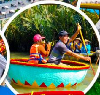
นั่งเรือกระดง