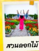
สวนดอกไม้

ไฮไลท์!! พาท่านขึ้นกระเช้าไฟฟ้าไม่มณนาฮิลล์