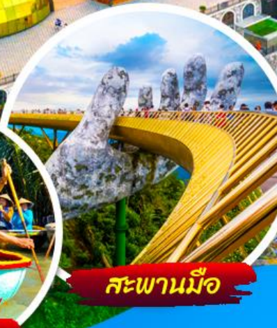
สะพานมือ