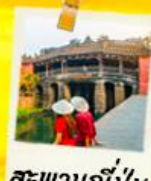
สะพานญี่ปุ่น