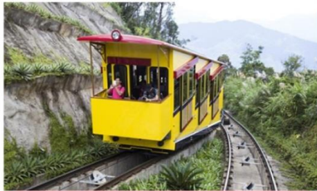
นั่งรกราง