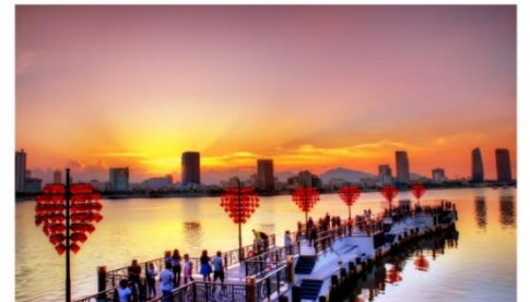
สะพานเลิฟบริดจ์