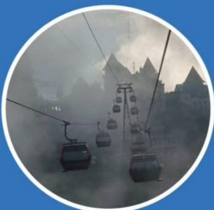
WINTER ธันวาคม-กุมภาพันธ์