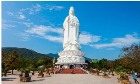
วัดเจ้าแม่กวนอิมหลินอิ่ง