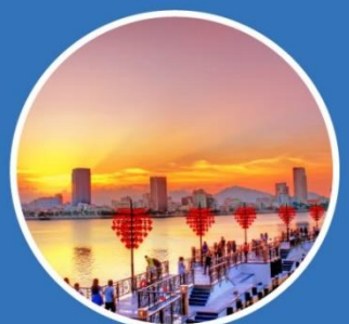
AUTUMN กันยายน-พฤศจิกายน