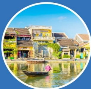
SPRING มีนาคม-พฤษภาคม