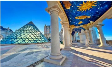
จัตุรัสแห่งดวงดาว