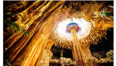
สวนสนุกแฟนตาซีพาร์ค