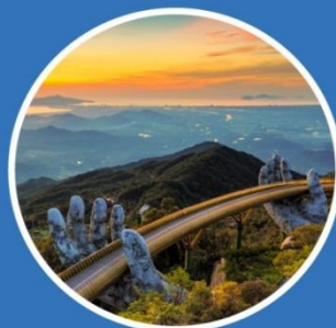
SUMMER มิถุนายน-สิงหาคม