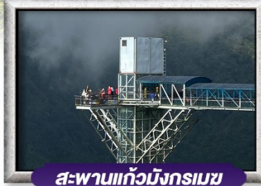
สะพานแก้วมิงกรเมซ