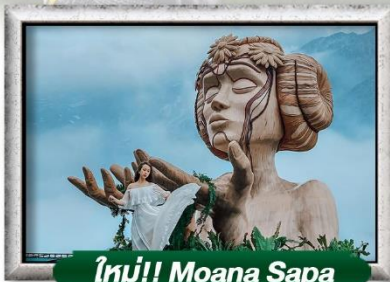
ใหม่!! Moana Sapa