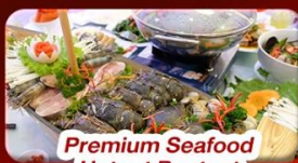
Premium Seafood Hotpot Boatget