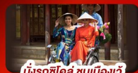
นั่งรถซิโคล ชมเมืองเว้