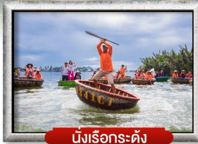
นั้งเรือกระดัง