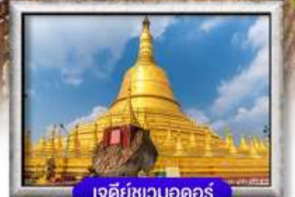
เจดีย์ชเวดอกอร์

พิเศษ!! BUFFET HOTPOT และ SEAFOOD นานาชาติ