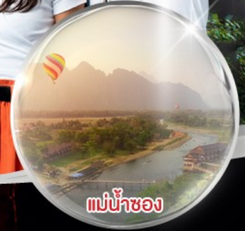
แม่น้ำซอง

โรงแรม Luxury.... จ่ายราคา Standard พัก 4 ดาว ตลอดทริป