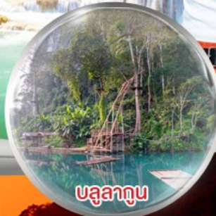
บลูลากูน