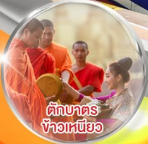
ตักบาตร ข้าวเหนียว