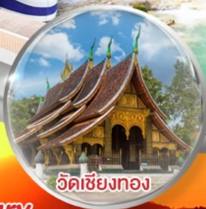
วัดเชียงทอง