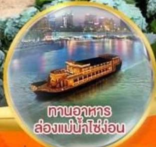
ทานอาหาร ส่องแม่น้ำโขงอัน