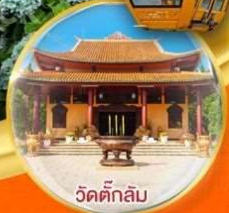
วัดตักสิลัม