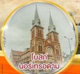
โบสถ์ นอร์เทรอดาม