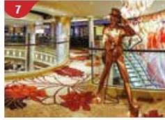
7 Johnnie Walker House™ Immerse yourself in the intricate world of premium Scotch whisky.