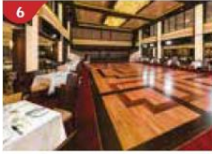
6 Dream Dining Room Savour a wide variety of Asian and international cuisine.