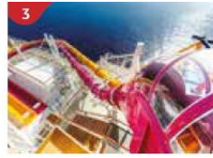
3 Waterslide Park Get drenched in fun on one of our six different waterslides.