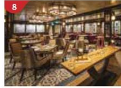
8 Bistro By Mark Best Relish contemporary Western cuisine from the internationally-acclaimed Australian chef.