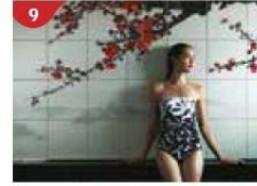
9 Crystal Life™ Spa Rejuvenate mind, body and soul with our holistic Western and Asian spa experience.