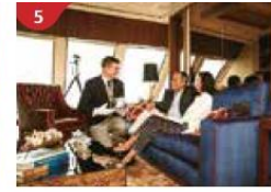
5 The Palace Indulge in European-style butler service and exclusive facilities.