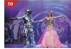
10 Zodiac Theatre Enjoy live production shows from the acclaimed award-winning entertainment team.