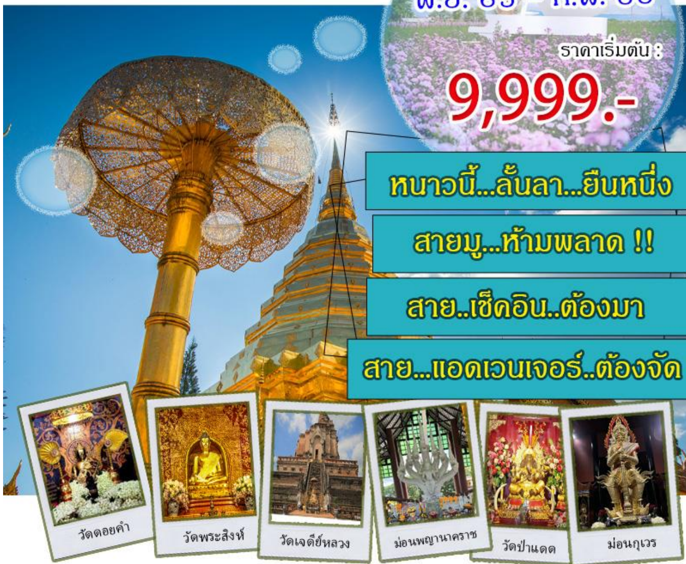
วัดดอยคำ