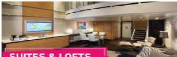
SUITES & LOFTS