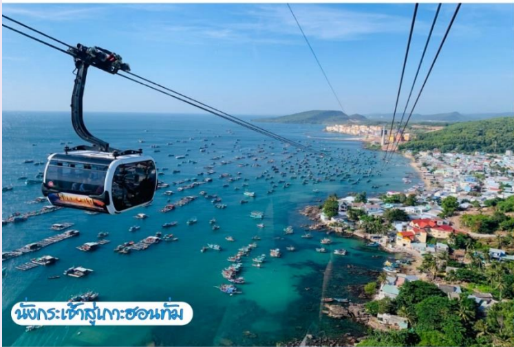
นั่งกระเช้าสู่เกาะฮอนทาม