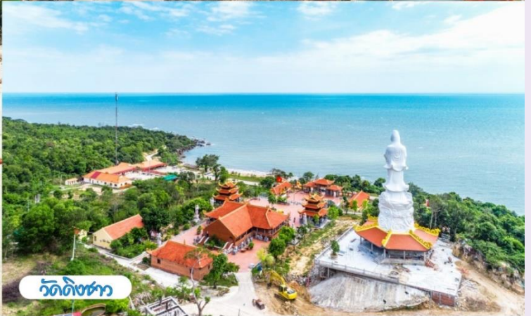
วัดดงซาว