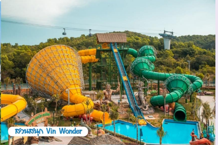
สวนสนุก Vin Wonder