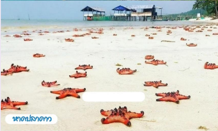
หาดปลาดุก