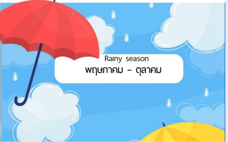
Rainy season พฤษภาคม - ตุลาคม