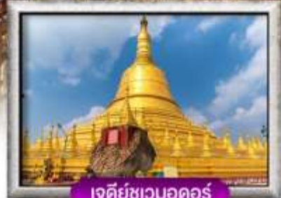
เจดีย์ชเวดออดอร์

พิเศษ!! BUFFET HOTPOT และ SEAFOOD นานาชาติ