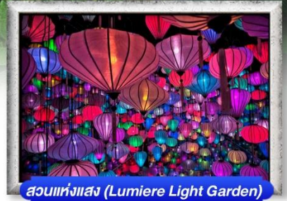
สวนแห่งแสง (Lumiere Light Garden)