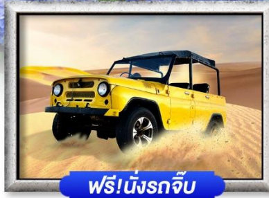
ฟรี!นั่งรถจี๊ป