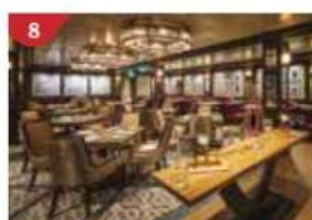
8 Bistro By Mark Best Relish contemporary Western cuisine from the internationally-acclaimed Australian chef.