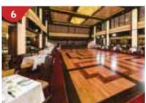
6 Dream Dining Room Savour a wide variety of Asian and international cuisine.