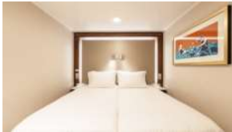
INSIDE พัก 1-2 ท่าน

**ห้องพักมีจำนวนจำกัด โปรดสอบถามห้องพักกับเจ้าหน้าที่ทุกครั้งก่อนทำการจองขอสงวนสิทธิ์ในการเปลี่ยนแปลงเงื่อนไขและราคา โดยไม่แจ้งให้ทราบล่วงหน้า**