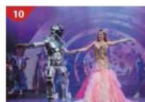
10 Zodiac Theatre Enjoy live production shows from the acclaimed award-winning entertainment team.