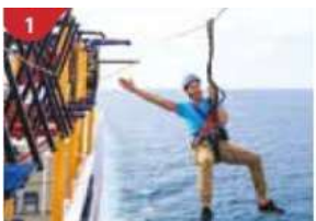
1 Ropes Course & Zipline Feel the thrill of gliding above the ocean on a 35-metre zipline.

สำหรับท่านที่ประสงค์ที่จะอยู่บนเรือ ท่านสามารถเข้าร่วมกิจกรรมที่ทางเรือจัดให้หรือพักผ่อนได้ตามอัธยาศัย กิจกรรมบนเรือคลิก