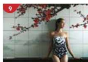
9 Crystal Life™ Spa Rejuvenate mind, body and soul with our holistic Western and Asian spa experience.