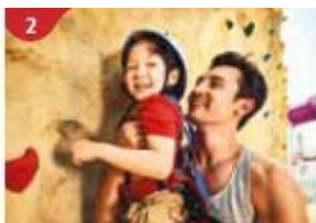
2 Rock Climbing Wall Challenge yourself on our mountainous rock climbing wall.