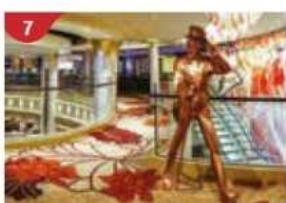
7 Johnnie Walker House™ Immerse yourself in the intricate world of premium Scotch whisky.