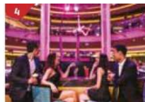
4 Bar 360 Catch live music and aerial acrobatic performances with a glass of champagne.