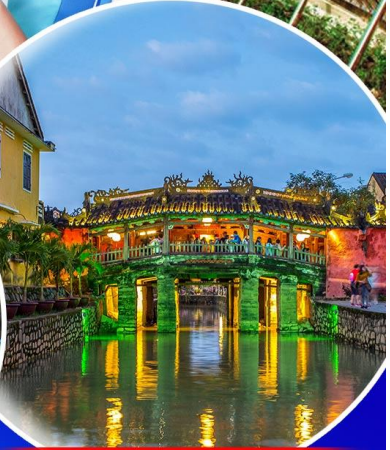
นั่งเรือกระดัง Hoi an