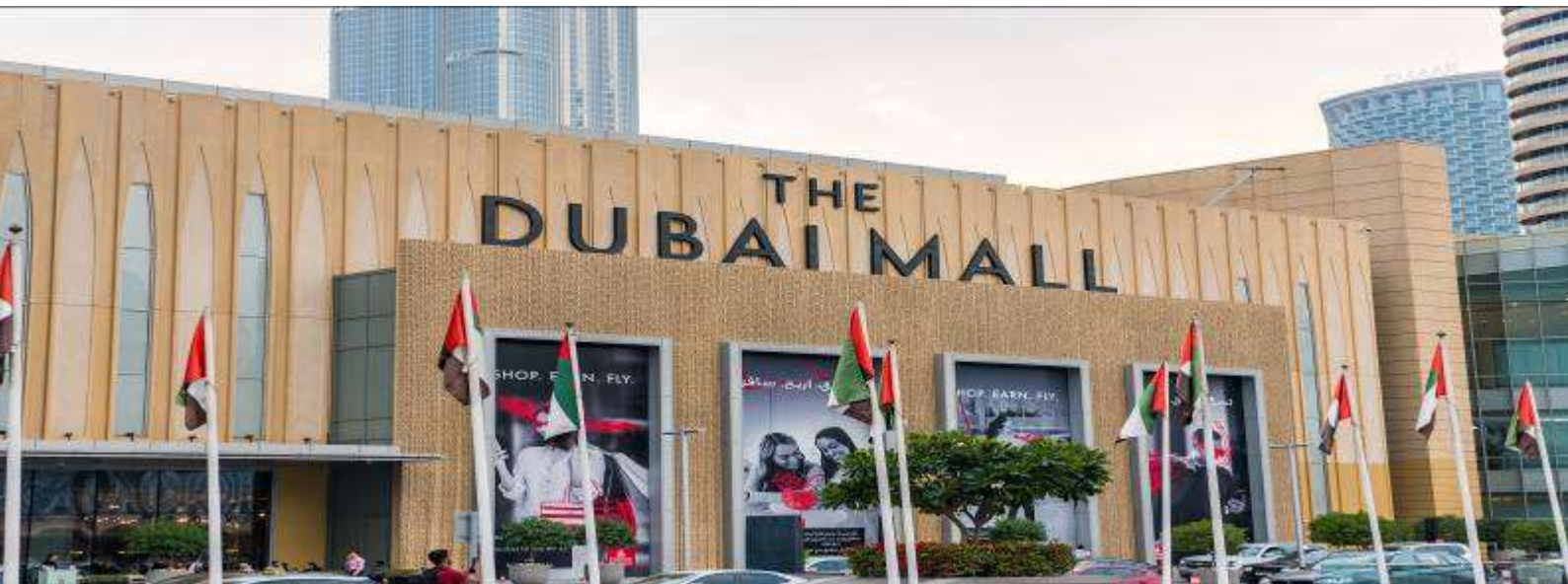
9. Burj Khalifa (ถ่ายรูปด้านนอก) และ Dubai Mall (เดินเที่ยวช้อปปิ้ง)