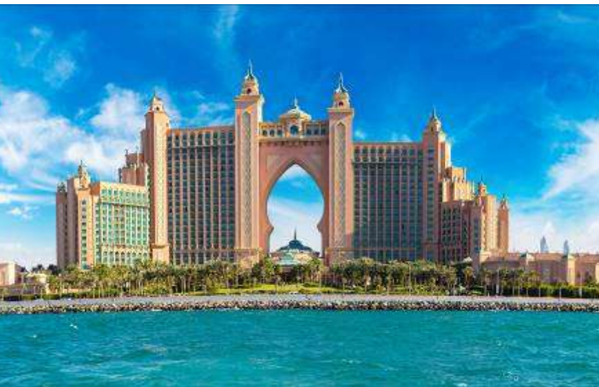
7. Atlantis, The Palm. Dubai Eye (ถ่ายรูปด้านนอก)