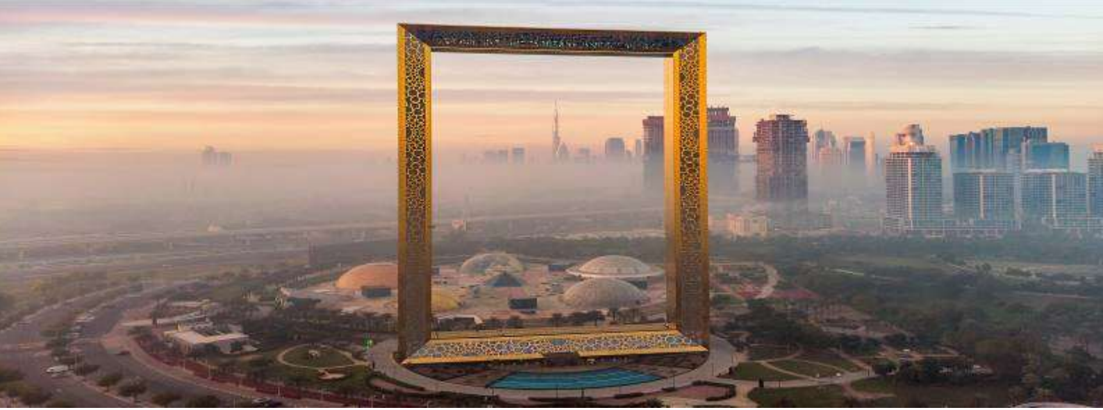
3. Dubai Frame Dubai Eye (ถ่ายรูปด้านนอก)