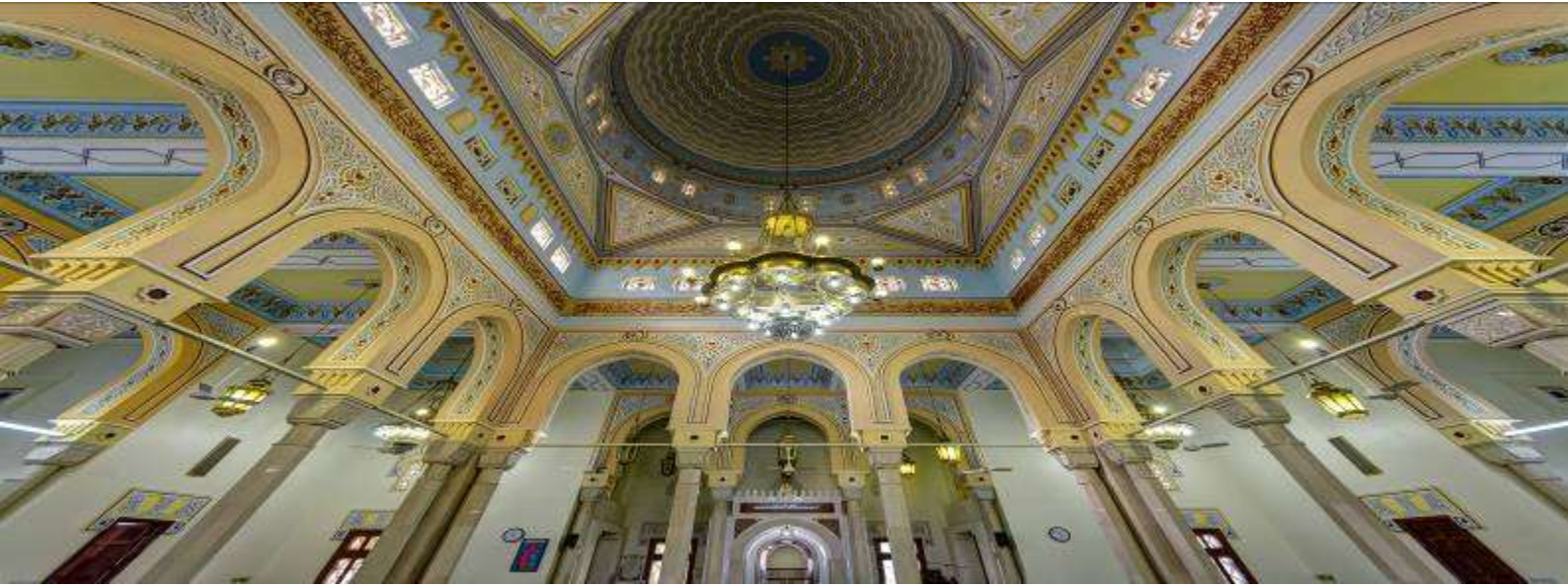
8. Jumeirah Mosque (เข้าชม)