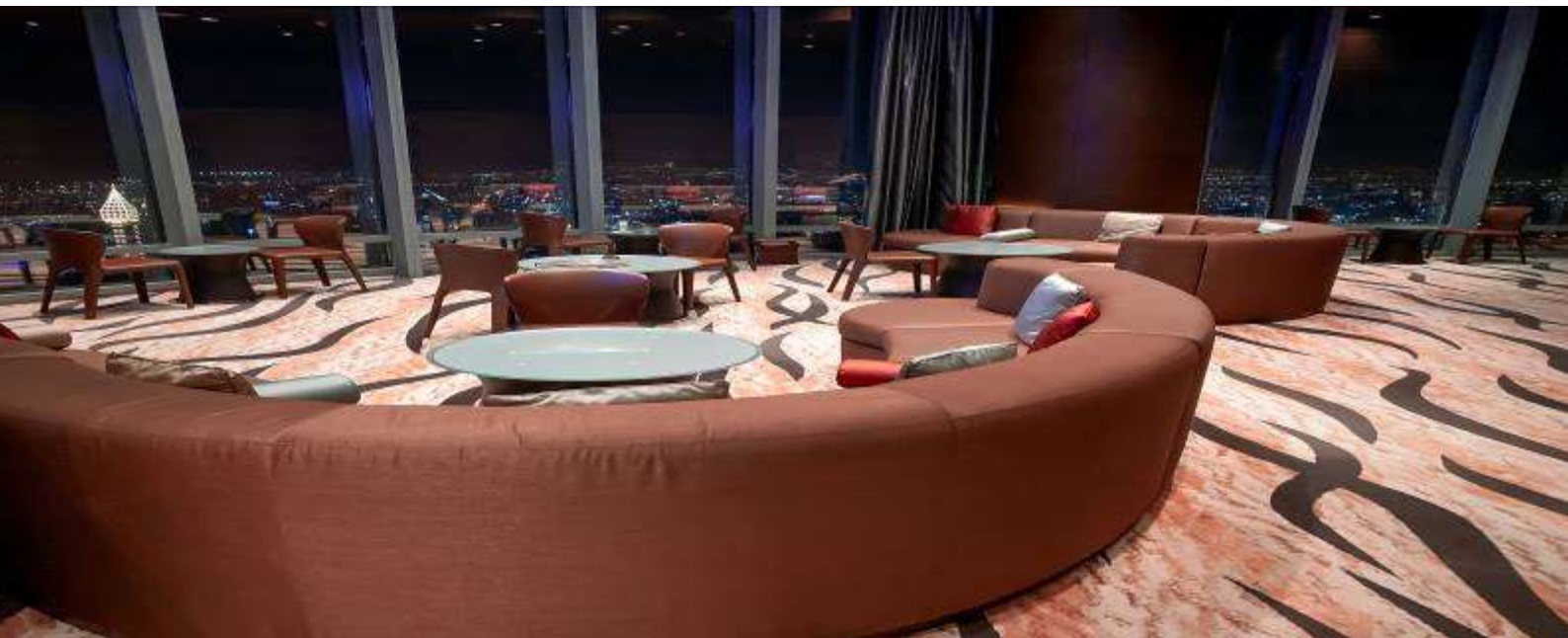
2.High Tea At Atmosphere restaurant 122th on The Burj Khalifa 122th