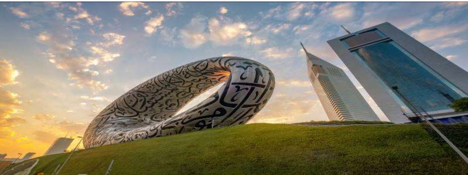
4. Museum of The Future, Dubai Eye (ถ่ายรูปด้านนอก)