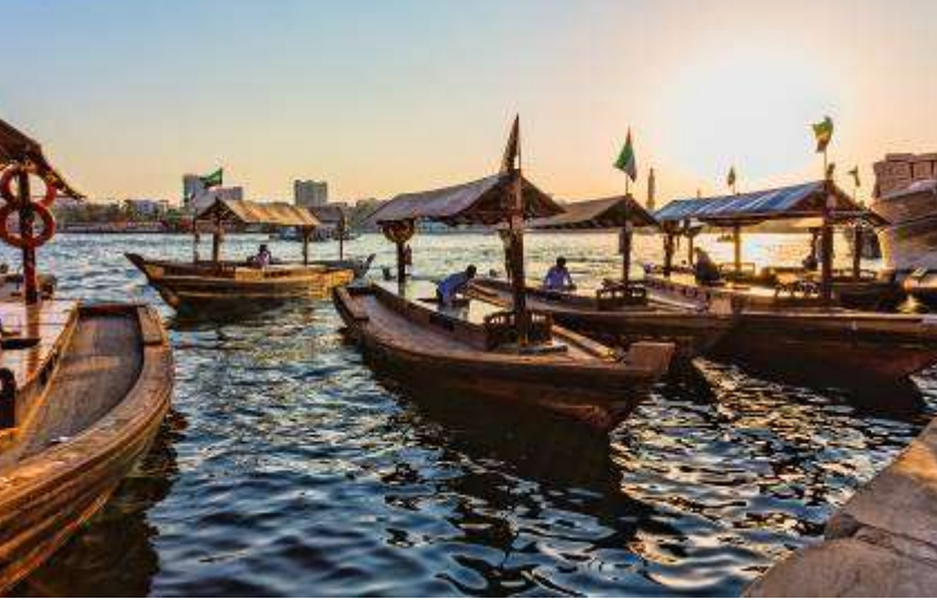
6. Abra boat นั่งเรือข้ามแม่น้ำ Creek