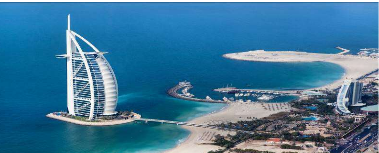
2. Burj Al Arab hotel & Jumeirah beach Dubai Eye (ถ่ายรูปด้านนอก)