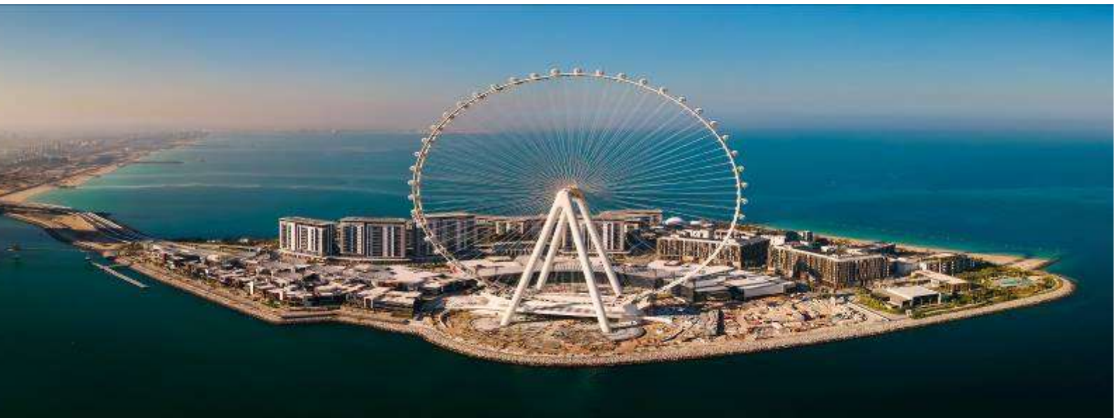
1. Dubai Eye (ถ่ายรูปด้านนอก)

ท่านสามารถเลือกสถานที่เที่ยวได้ 3 แห่ง จากตัวเลือกทั้งหมดนี้