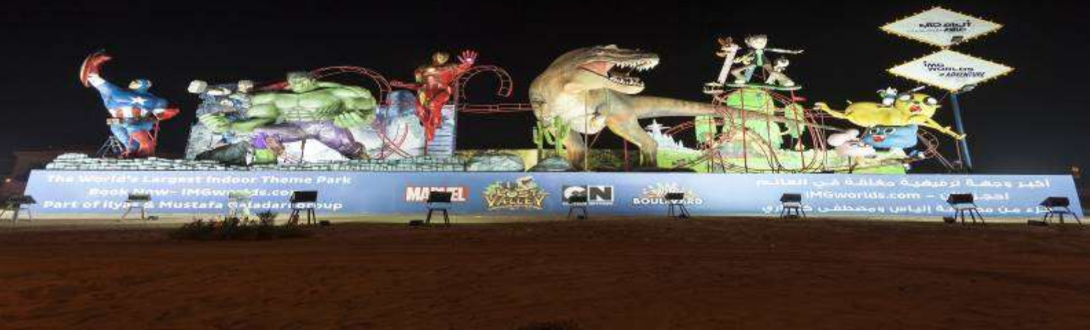
3.IMG Worlds of Adventure