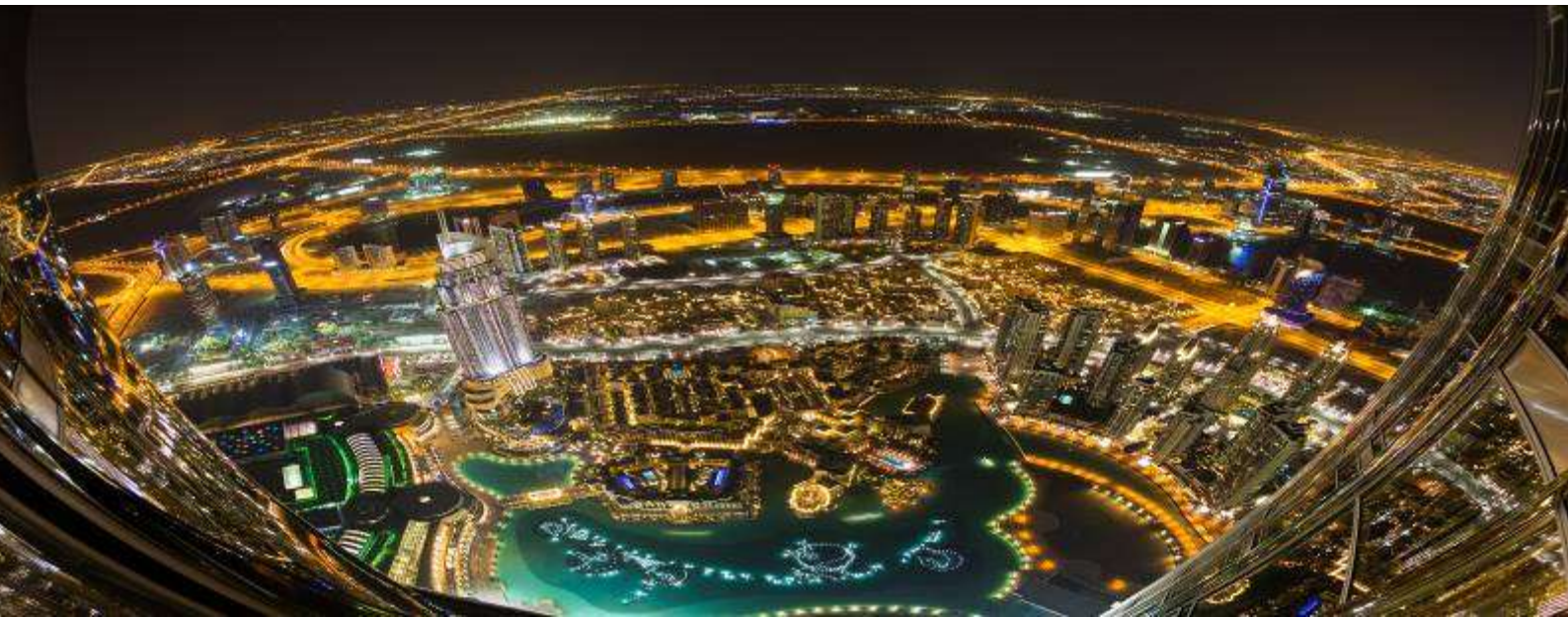
1.The Burj Khalifa 124 th Observation Deck

เดินทางถึงเมืองดูไบ ประเทศสหรัฐอาหรับเอมิเรตส์ นำท่านเดินทางสู่โรงแรมที่พักในเมืองดูไบ หากท่านต้องการหารายการท่องเที่ยวเสริม ท่านสามารถเลือกซื้อเป็น optional tour ได้ดังนี้