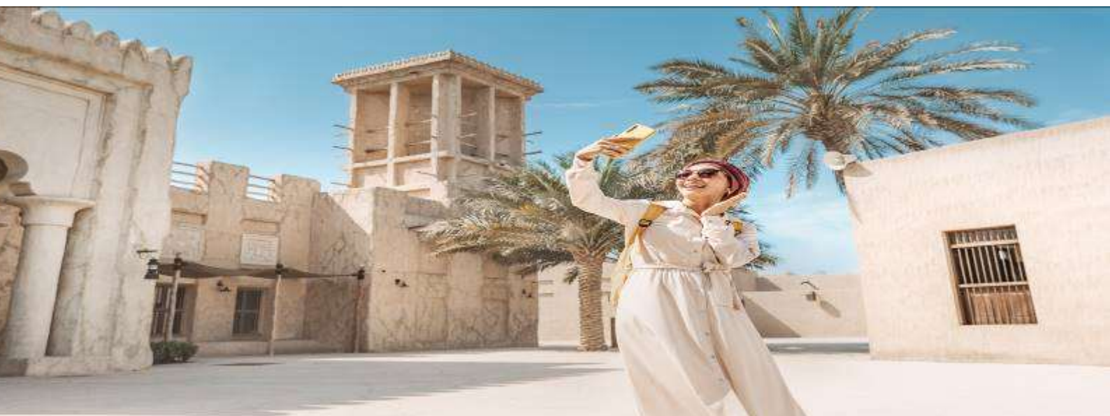
5. Dubai Museum (เข้าชม)