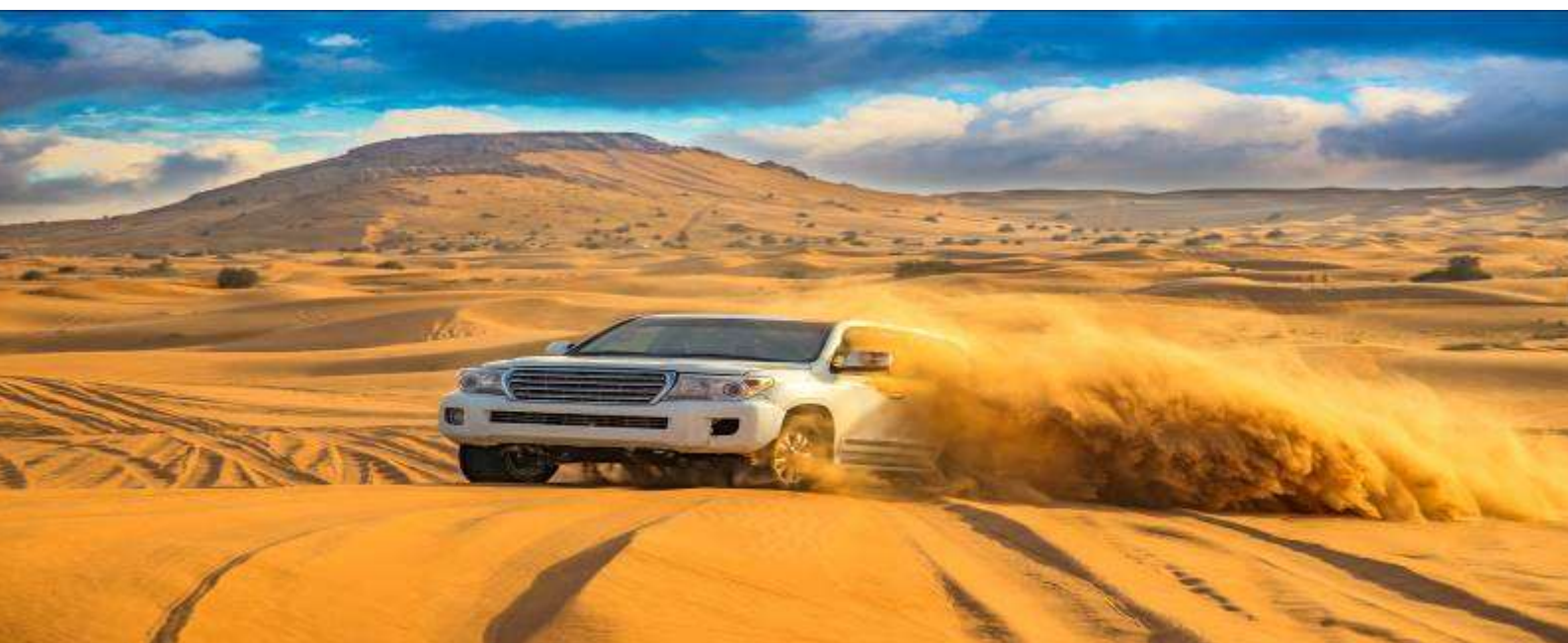
4.Dubai Desert Safari Tour with Dinner (join tour)