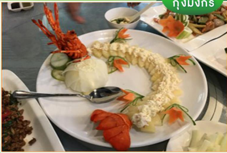
กุ้งมังกร