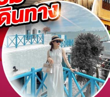
คาเฟ่ใหม่ SON TRA MARINA