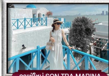
คาเฟ่ใหม่ SON TRA MARINA