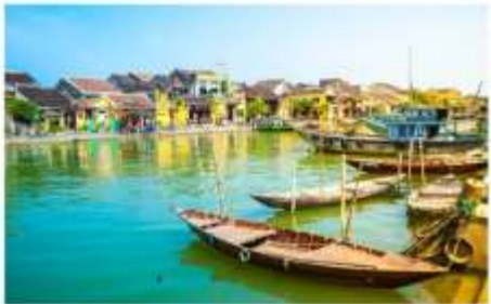
ฮอยอัน เมืองมรดกโลก