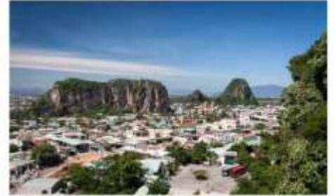
หมู่บ้านแกะสลักหินอ่อน