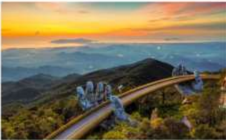
สะพานลอยฟ้า Golden Bridge