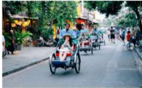
นั่งสามล้อชมเมืองฮอยอัน