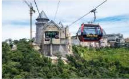
ขึ้นกระเช้าลอยฟ้า