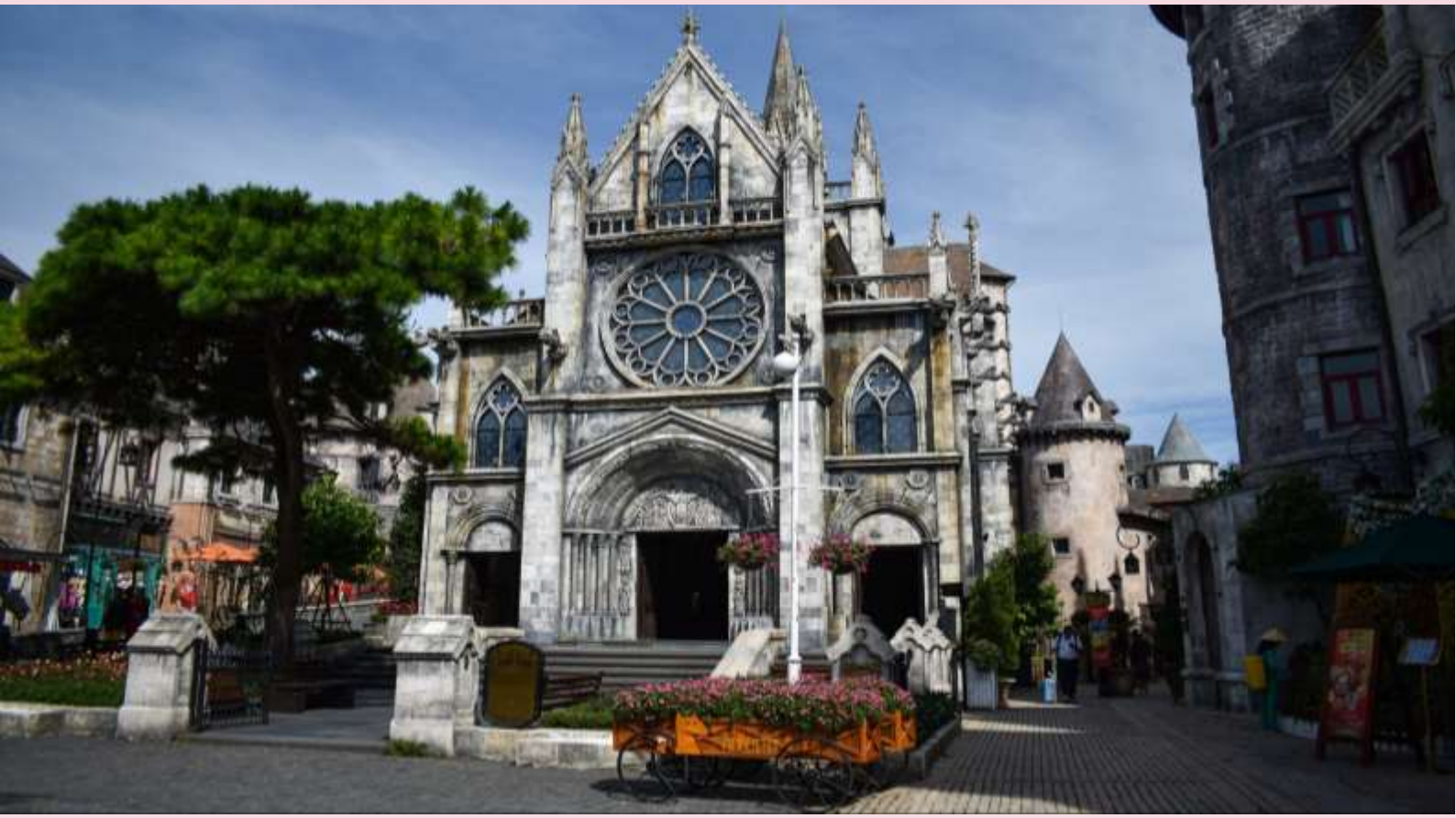
โบสถ์ เซนต์เดนิส โบสถ์คาทอลิกที่หมู่บ้านฝรั่งเศสบนบานานาฮิลส์, เวียดนาม

สวนสนุกแฟนตาซีพาร์ค สวนสนุกในร่มและกลางแจ้งขนาดใหญ่มีหลายโซนให้ร่วมสนุกไม่ว่าจะเป็น จูราสสิก พาร์ค (Jurassic Park) ท่องโลก ล้านปี , เอาทรีน (Ourren) สนุกสุดเหวี่ยงกับเกมขับรถราวกับอยู่สนามแข่ง, อันเดอร์กราวด์ ทริป (Underground Trip) พจญภัยแทนโลกกับความ มืดใต้ดิน , สไปเดอร์แมน (Spider Man) ใต้หน้าผาสูง 21 เมตร , ภาพยนตร์ในระบบ 3D,4D,5D , บ้านผีสิง