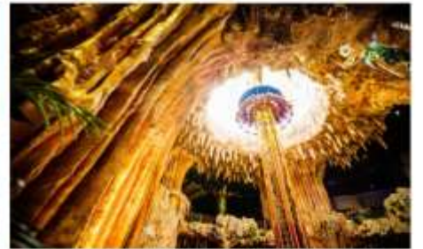
สวนสนุกแฟนตาซีพาร์ค