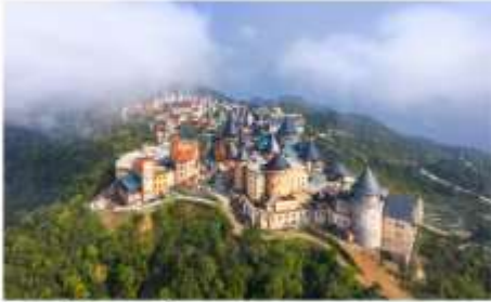
หมู่บ้านฝรั่งเศส