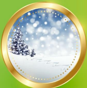
WINTER ธันวาคม-กุมภาพันธ์