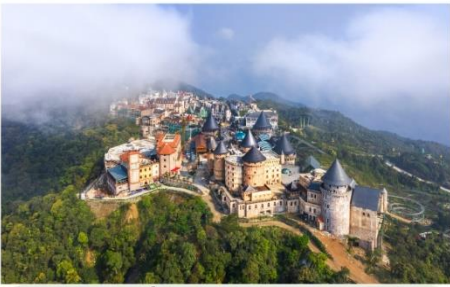
หมู่บ้านฝรั่งเศส