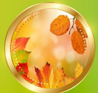
AUTUMN กันยายน-พฤศจิกายน