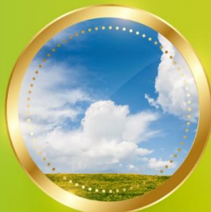
SPRING มีนาคม-พฤษภาคม