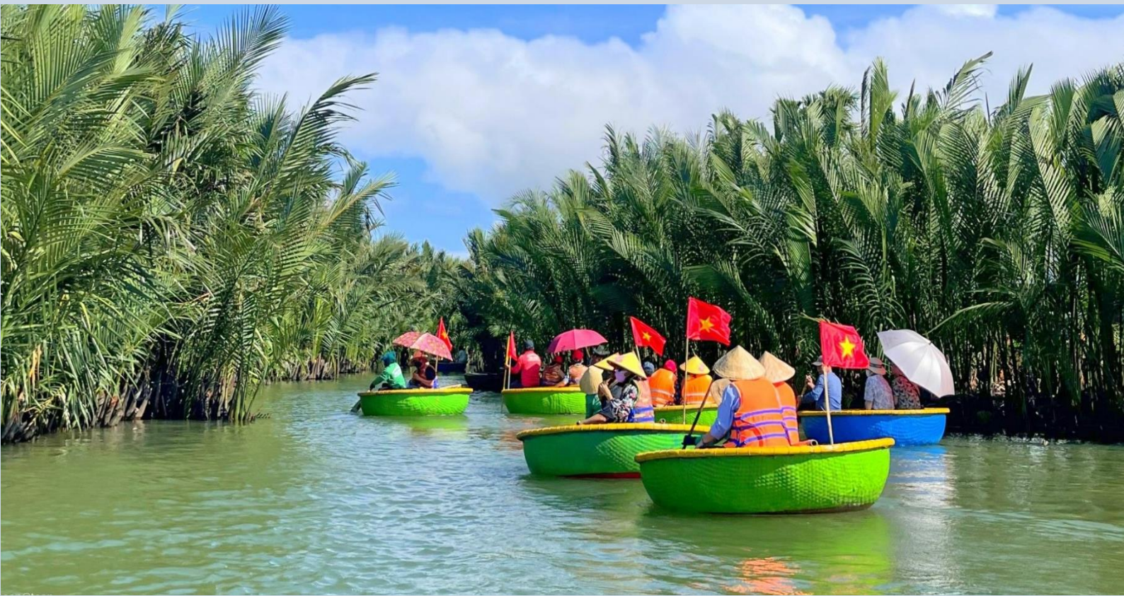
คือ จีน ญี่ปุ่นและเวียดนาม

อิสระถ่ายภาพที่ สะพานญี่ปุ่น สะพานเก่าแก่กว่า 400 ปี และเป็นสัญลักษณ์ของเมืองมรดกโลกฮอยอันชม บ้านโบราณเลขที่101 บ้านต้นก๊ เป็นบ้านไม้สองชั้นที่สวยงามและเก่าแก่ที่สุดในฮอยอัน หลังคาทรงกระดองปูศิลปะผสมผสานกันอย่างลงตัวถึง 3 ชาติ