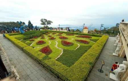
สวนดอกไม้แห่งความรัก