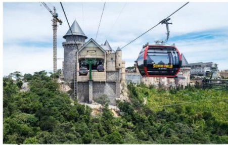
ขึ้นกระเช้าลอยฟ้า