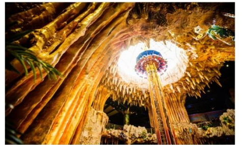
สวนสนุกแฟนตาซีพาร์ค