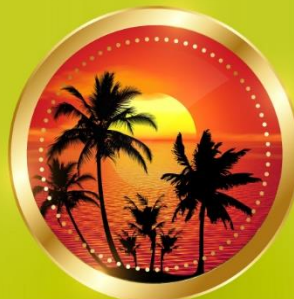
SUMMER มิถุนายน-สิงหาคม