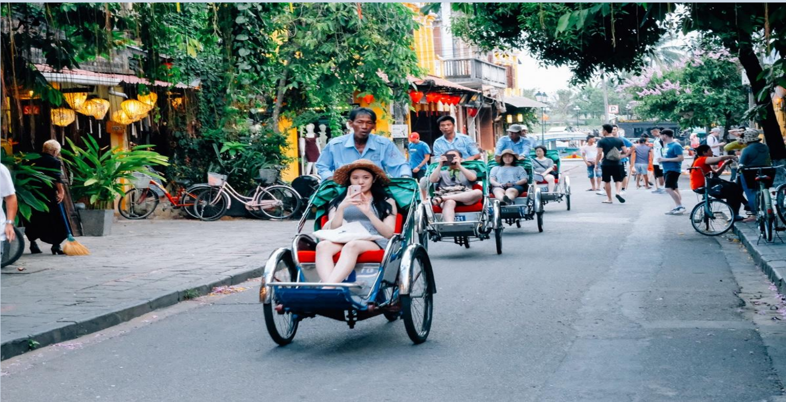
แนะนำ!! นั่งสามล้อชมเมืองฮอยอัน (หากสนใจกรุณาแจ้งในวันจองจ่ายเพิ่ม 359 บาท/ท่าน)