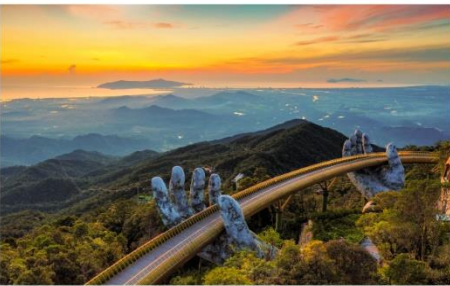
สะพานลอยฟ้า Golden Bridge