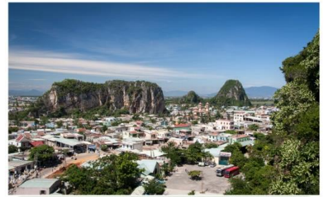
หมู่บ้านเกาะสลักหินอ่อน