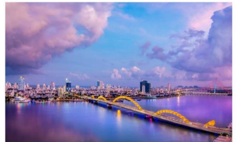
ชมสะพานมังกร