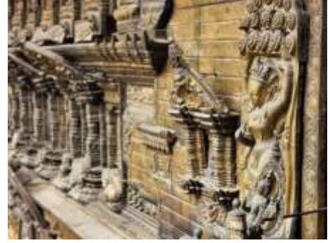
พระศรีศากยะมุนี ( พระพุทธเจ้าองค์ปัจจุบัน )