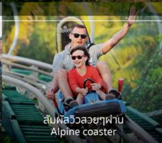
สัมผัสวิวสวยๆ ผ่าน Alpine coaster