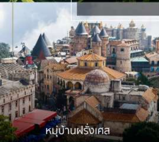
หมู่บ้านฝรั่งเศส