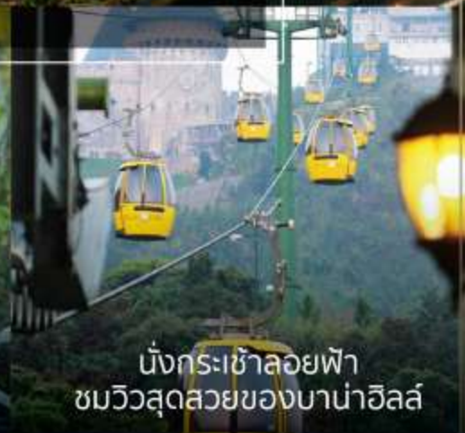
นั่งกระเช้าลอยฟ้า ชมวิวสุดสวยของบานาฮิลล์